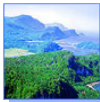
Parc du Bic

Le Club de Golf Bic a une réputation enviable au Québec. Son site exceptionnel et l'accueil réservé aux visiteurs en font un endroit recherché par les golfeurs et golfeuses.